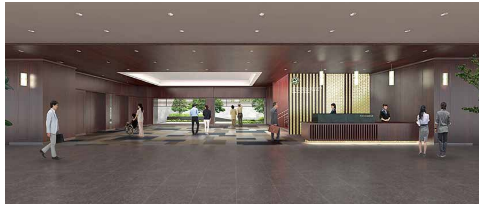
健診棟1F メインエントランス