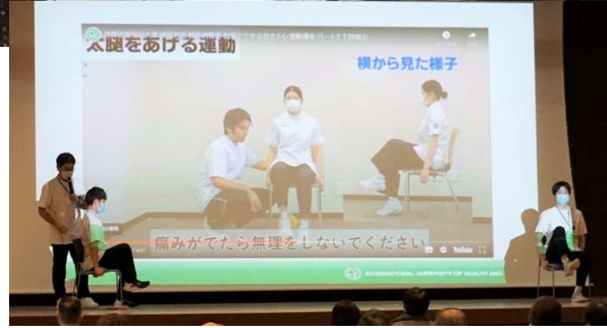
リハビリテーション室スタッフによる運動紹介