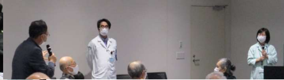
参加者からの質問を受ける高村・管理栄養士