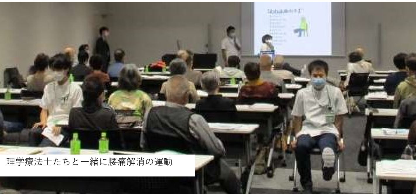
理学療法士たちと一緒に腰痛解消の運動