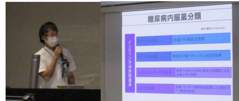
吉野・薬剤師による 糖尿病の飲み薬について