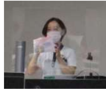
織田・診療看護師による 災害時の持ち出し品チェック