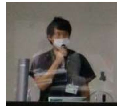
吉野・薬剤師による シックデイ時の薬について