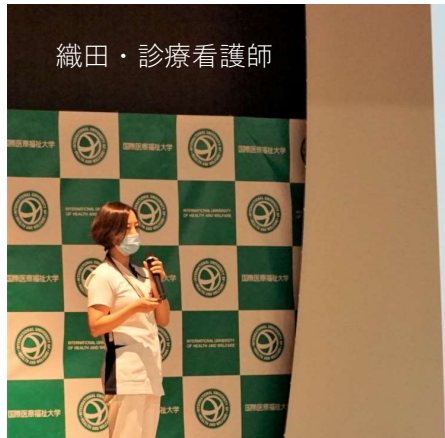
織田・診療看護師