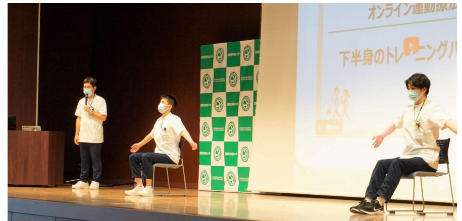
リハビリテーション室スタッフと一緒に運動